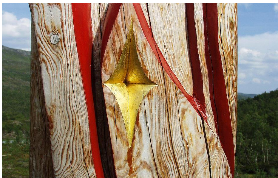
Bilde lånt fra Bente Haarstads nettside, Ingunn Utsis skulptur «Påminnelsen», foto: Bente Haarstad

Om mulighet: lag en liten utstilling i klasserommet eller et sted på skolen.